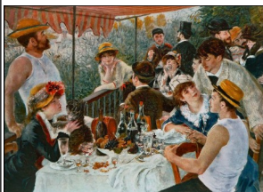
A. Renoir. Le dèjeuner des canotiers

La formula escogitata lo scorso anno ha avuto successo... e quest'anno verrà ripetuta, con varianti migliorative. Sarà un pomeriggio divertente e rilassante, e ringraziamo fin da ora coloro che hanno contribuito e contribuiranno generosamente alla preparazione, allestimento e realizzazione dell'evento. Per i dettagli, vedere il programma.